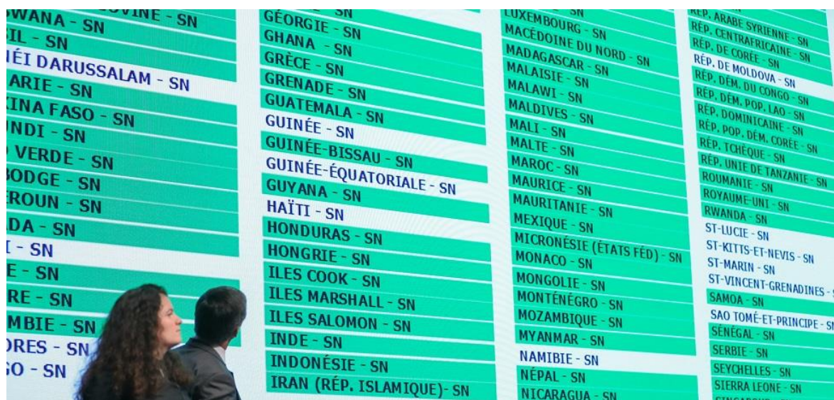
výsledky prezence před volbou stálé komise

XXXIII. Mezinárodní konference se zúčastnilo 168 vládních delegací (včetně všech velmocí a stálých členů RB OSN), delegace MVČK, 187 delegací národních společností a delegace MF ČK&ČP 3 a 75 pozorovatelů (OSN, WHO, FAO aj.). Přítomno bylo více než 2.300 účastníků.