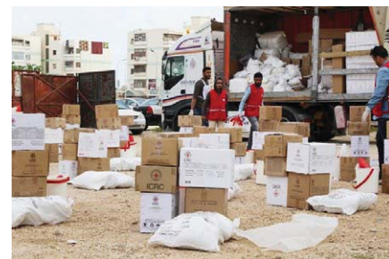
Distribuce ochranných prostředků