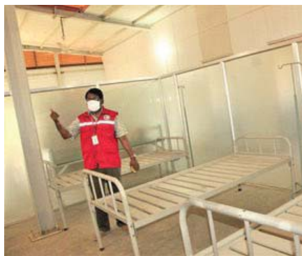
Nemocnice Červeného kříže v Cox's Bazar