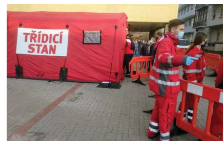
Třídící stan ČČK - nemocnice v Ústí nad Labem

Slovem roku 2020 bude možná „rouška“. Tato ochranná pomůcka je viditelným symbolem úsilí Česka zvládnout šíření Covid-19. Šití, sběr a distribuce roušek, včetně těch „nešitých“ je samozřejmě i součástí pomoci Českého červeného kříže se zvládnutím pandemie. Co dalšího ale ČČK poskytoval na této „frontě“?