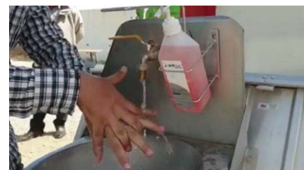
Mytí rukou je základním protiepidemickým opatřením