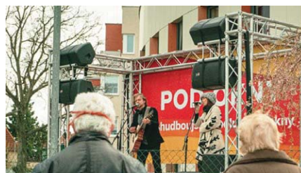
14. 4. 2020 – Dům pro seniory hvězda

V rámci projektu Koncert pod okny vykouzlil svými písničkami úsměv na tváři klientům Domova seniorů Hvězda Tomáš Klus. Projekt pořádají Ceny Anděl, Coca-Cola ve spolupráci s Českým červeným křížem, mediálním partnerem byla Evropa 2. Projekt odstartoval 14. 04. 2020 a zahrnoval sérii 20 minutových koncertů pro 25 domovů v Praze, středních a severních Čechách. Mezi dalšími interprety, kteří seniory potěšili, jsou Ewa Farna, Anna K., Richard Krajčo, Ondřej Ruml a Iva Pazderková. Nezůstalo však jen u zpívání, senioři též obdrželi dárky od Coca-Cola, od společnosti ADLER Czech a.s., Supraphonu, Alza nebo od Kytky od Pepy a Lucernička Flowers.