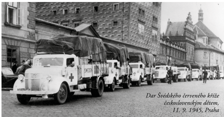
Dar Švédského červeného kříže československým dětem, 11. 9. 1945, Praha

Jaké plnil exilový ČSČK úkoly? V první řadě byl pomocnou organizací vojenské zdravotnické služby československé armády, samozřejmě i mimo britské území, staral se o výcvik zdravotnického perso-