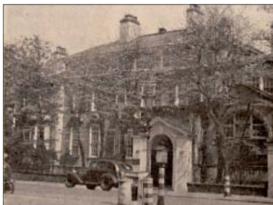
Sídlo ČSČK v Londýně za 2. světové války

Místnosti jednotlivých odborů našel redaktor Benau nad ordinacemi. „Ošetřovatelský odbor vede školení a výcvik dobrovolných ošetřovatelek. Bude jich třeba v osvobozené republice. Ošetřovatelky, které složí s úspěchem kurs, jsou potom přiděleny do anglických nemocnic, aby získaly i praktický výcvik.“ uvedl ve svém článku. Dále představil i práci sociálního odboru, o němž se dozvěděl, že zkoumá zejména sociální problémy čs. příslušníků a určuje, kde a jak je třeba mimořádné pomoci. „Tento odbor pečuje i o čs. rodičky v Anglii. Dává potřebným vybavičky, příspěvek na kočárek, ošacovací pomoc pro děti i těhotné ženy. Během roku se vydalo 195 kompletních a 125 částečných vybaviček a 274 příspěvků na dětský kočárek“.