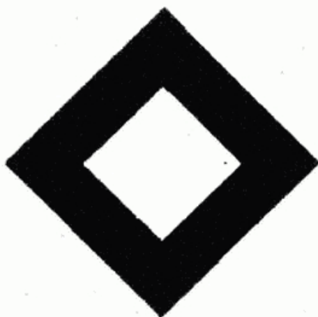
Článek 2 – Identifikační použití znaku Třetího protokolu